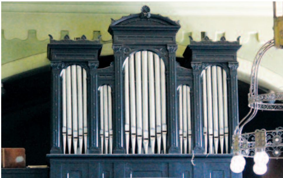
A díszterem orgonája

1920 áprilisától egészen 1939. szeptember 1-ig a kollégium igazgatója Nagy Endre. Ez az időszak a majdnem 400 éves iskola egyik legnehezebb időszaka, mivel története során először válik kisebbségi iskolává, lét és nemlét határán kell mindennapos harcot folytatnia